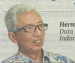
Hermono, Duta Besar Indonesia

"Saya akan menasihati mana-mana majikan yang sudah dikenakan bayaran tinggi supaya melaporkan agensi itu kepada kedutaan dan kami akan mengambil tindakan segera"