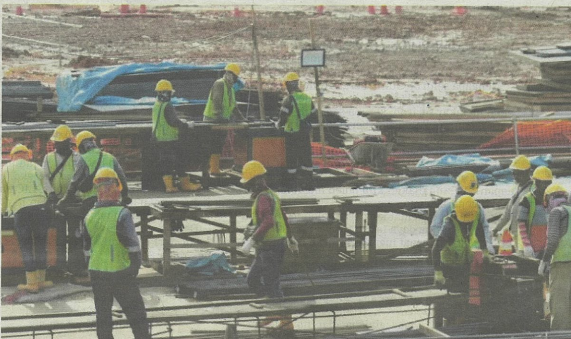
Pengambilan pekerja asing termasuk dalam sektor pembinaan ikut keperluan.

Katanya, pengambilan itu akan dilaksanakan secara berperingkat mengikut keperluan dan perancangan majikan, kerana mereka mempunyai tempoh sehingga 18 bulan untuk membawa masuk pekerja warga asing selepas bayaran levi diselesaikan. BERNAMA